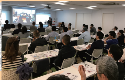
大手銀行との共催セミナー